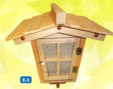
E-3 高灯笼(本体のみ)1ヶ

一般価格▶14,300円(税込) フレンド会 会員価格 10,000円 (税込) ●電球・電源コード約20m付 ●戒名・名入